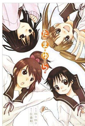
たまゆら © 佐藤順一・TYA / たまゆら制作委員会 © momo / マッグガーデン