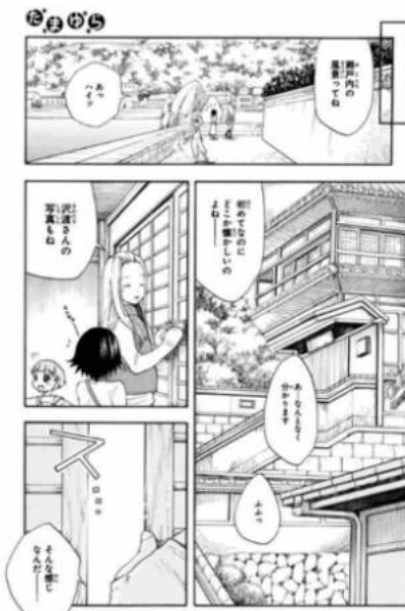
たまゆら ©佐藤順一・TYA / たまゆら制作委員会 ©momo / マッグガーデン

「たまゆら」(佐藤順一／マッグガーデン) https://sp.comics.mecha.cc/books/85242