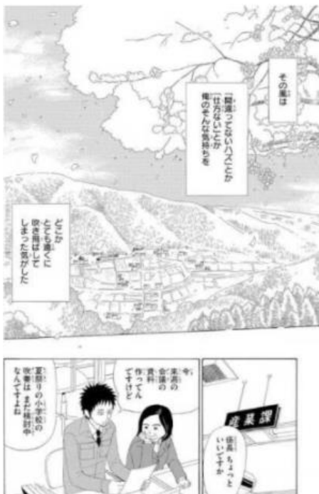
雨無村役場産業課兼観光係 © 岩本ナオ／小学館

「雨無村役場産業課兼観光係」(岩本ナオ／小学館) https://sp.comics.mecha.cc/books/69533