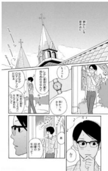
坂道のアポロン ©小玉ユキ／小学館

「坂道のアポロン」(小玉ユキ／小学館) https://sp.comics.mecha.cc/books/46872