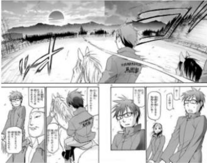
銀の匙 © 荒川弘／小学館

「銀の匙」(荒川弘／小学館) https://sp.comics.mecha.cc/books/71070