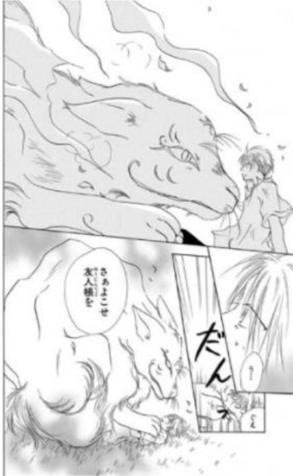
夏目友人帳 © 緑川ゆき／白泉社

「夏目友人帳」(緑川ゆき／白泉社) https://sp.comics.mecha.cc/books/67385