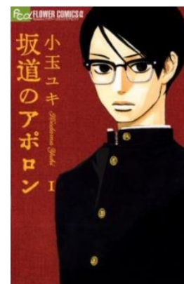
坂道のアポロン © 小玉ユキ／小学館