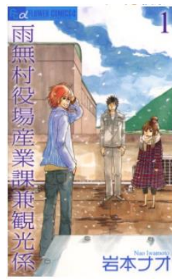
雨無村役場産業課兼観光係 © 岩本ナオ／小学館