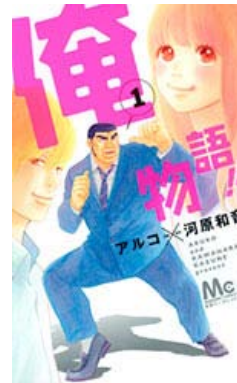
(C) アルコ・河原和音/集英社