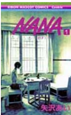
(C) 矢沢漫画制作所/集英社