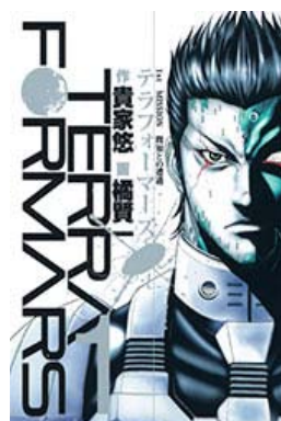
(C) 貴家悠・橘賢一/集英社