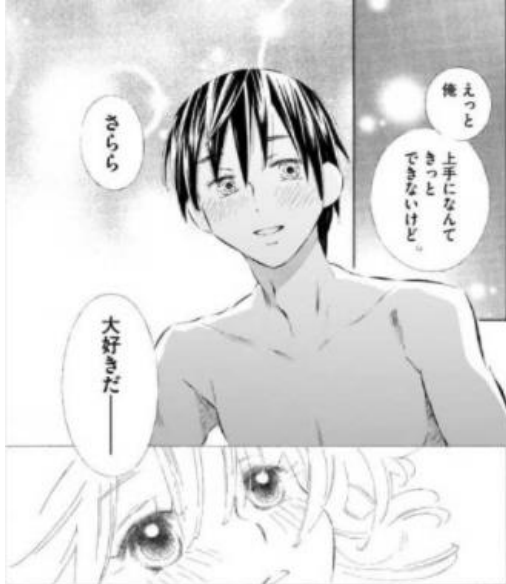
ハニーハニー・ビギナーズ © せきね小桃/白泉社

そんな水瓶座と相性がいいのは、のんびりした性格の人。心優しく、どんなことがあってもどーんと受け入れてくれるような人が、あなたが自分らしくいられる心地よい空気をつくってくれるでしょう。