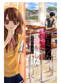
ヒミツなキミに恋をした © 星森ゆきも／小学館