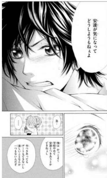
センセイの彼女 © 京町妃紗／小学館

そんな牡羊座と相性がいいのは、あなたを甘えさせてくれる年上の男子。つい強がってしまいがちなあなたを受け止め、導いてくれる相手がおすすめです。