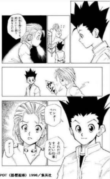
HUNTER×HUNTER © POT/集英社

そんな獅子座と相性がいいのは、裏表がなくストレートな人。友だち思いでいつも一生懸命、そしてあなたに対しても常にまっすぐ向き合ってくれる相手に、計算的なあなたの心も動かされ、素直になれることでしょう。