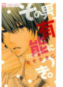
その男、有能につき。 © ももたまこ／小学館