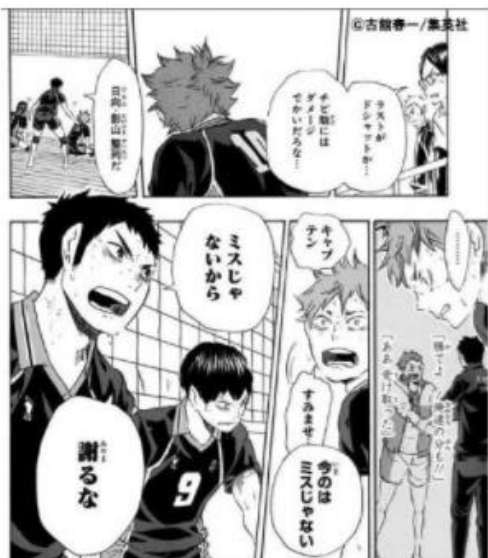
ハイキュー © 古館春一／集英社

そんな牡牛と相性がいいのは、真面目で責任感の強い人。ときに優しく、ときに厳しく導いてくれる頼れる彼だったらあなたも「この人なら人生を託しても大丈夫」と安心できるでしょう。