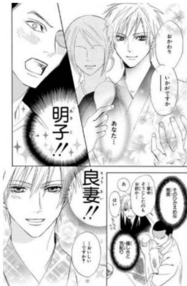
オトメン(乙男) © 菅野文/白泉社

そんな双子座と相性がいいのは、あなた以上に個性的でハイセンスな持ち主の人。この人と生活すれば、今よりもっと楽しいことが起こりそうだと感じられる人がおすすめです。