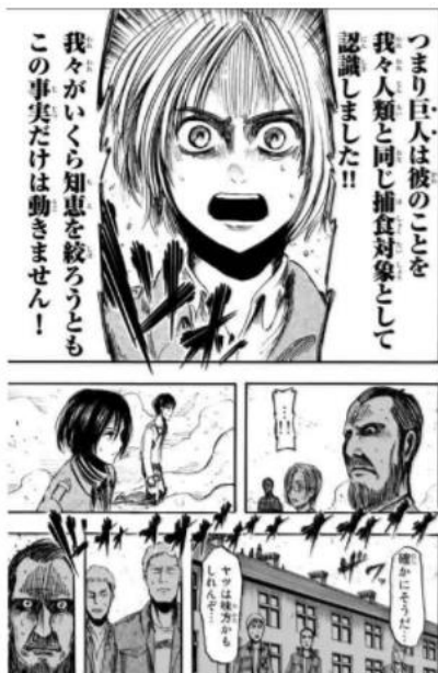
進撃の巨人 © 諫山創/講談社

そんな乙女座と相性がいいのは、頭の回転が早い人。あなたが迷っているときには、きちんと論理的に考えて「こうしたほうがいいよ」とアドバイスをくれる人がおすすめです。