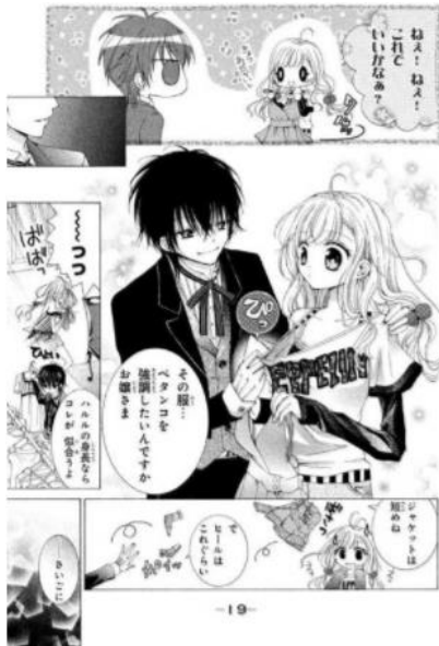
甘い悪魔が笑う © 鳥海ペドロ/講談社

そんな射手座と相性がいいのは、ミステリアスな男子。知れば知るほど謎が深まるその人に、あなたの興味は尽きることがありません。刺激たっぷりの結婚生活を送れる相手がおすすです。