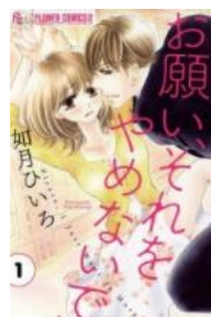
お願い、それをやめないで © 如月ひいろ／小学館