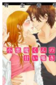
小悪魔くんの甘い囁き © 有生青春・GSST