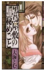
黒鷲屋敷の秘めごと © 大海とむ／小学館