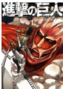
進撃の巨人 © 諫山創／講談社