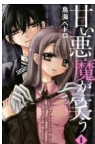
甘い悪魔が笑う © 鳥海ペドロ／講談社