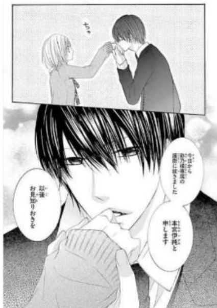
その男、有能につき。 © ももたまこ/小学館

そんな魚座と相性がいいのは、どんなときもあなたを守ってくれる人。優しく頼れるけどちょっと強引なところもある彼に守られながらの甘い生活が理想です。