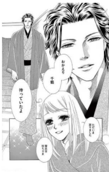
黒鳶屋敷の秘めごと © 大海とむ/小学館

そんな蟹座と相性がいいのは、あなたのすべてを溺愛してくれる人。あなたがほかの人をしているように、あなたのことを一番に考え、すべてを受け止めてくれる人がおすすめです。