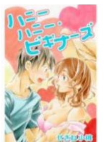
ハニーハニー・ビギナーズ © せきね小桃／白泉社