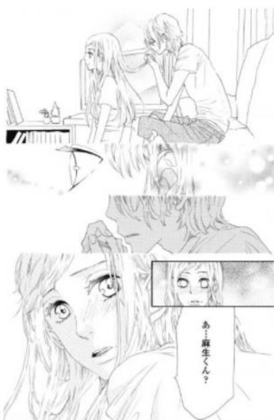
小悪魔くんの甘い囁き

そんな山羊座と相性がいいのは、さびしがりやで甘えん坊な男子。あなたを信頼して甘えてくる彼がかわいくて仕方なくなってしまう。何をしても一緒に甘い結婚生活が待っている。