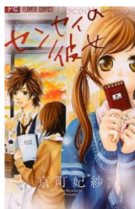
センセイの彼女 © 京町妃紗／小学館

今回のテーマは、『星座から見る相性抜群の男性』ということで、12星座ごとにぴったりの結婚相手を診断し、おすすめのマンガキャラを探し出しました。7月7日の七夕に出会う織姫と彦星のような、あなたにぴったりの運命の相手探しに役立ててみてはいかがでしょうか。