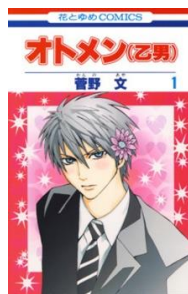
オトメン(乙男) © 菅野文／白泉社